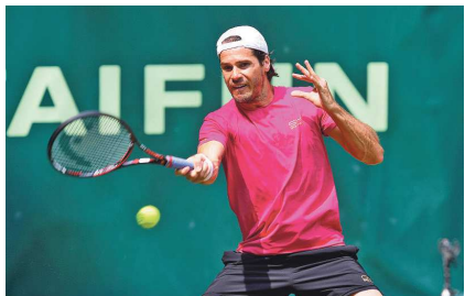
Nationale und internationale Tennis-Stars bei der „schausland-reisen Champions Trophy“ leiten die 26. Gerry Weber Open ein: Dabei sein wird auch Tommy Haas, die ehemalige Nummer zwei der Welt.

Die Preise der Eintrittskarten für die „schausland-reisen Champions Trophy“ sind im Internetportal der Gerry Weber Open nachzulesen. Der Erwerb von Eintrittskarten ist sowohl unter der Tickethotline 05201-8180 als auch im Internet unter www.gerryweber-open.de und bei allen CTS-Vorverkaufsstellen möglich. Das Gerry Weber Ticket-Center ist via Email unter karten@gerryweber-world.de zu erreichen und hat die Anschrift: Weidenstraße 2 (direkt an der B68 Richtung Osnabrück/Bielefeld gelegen) in 33790 Halle Westfalen.